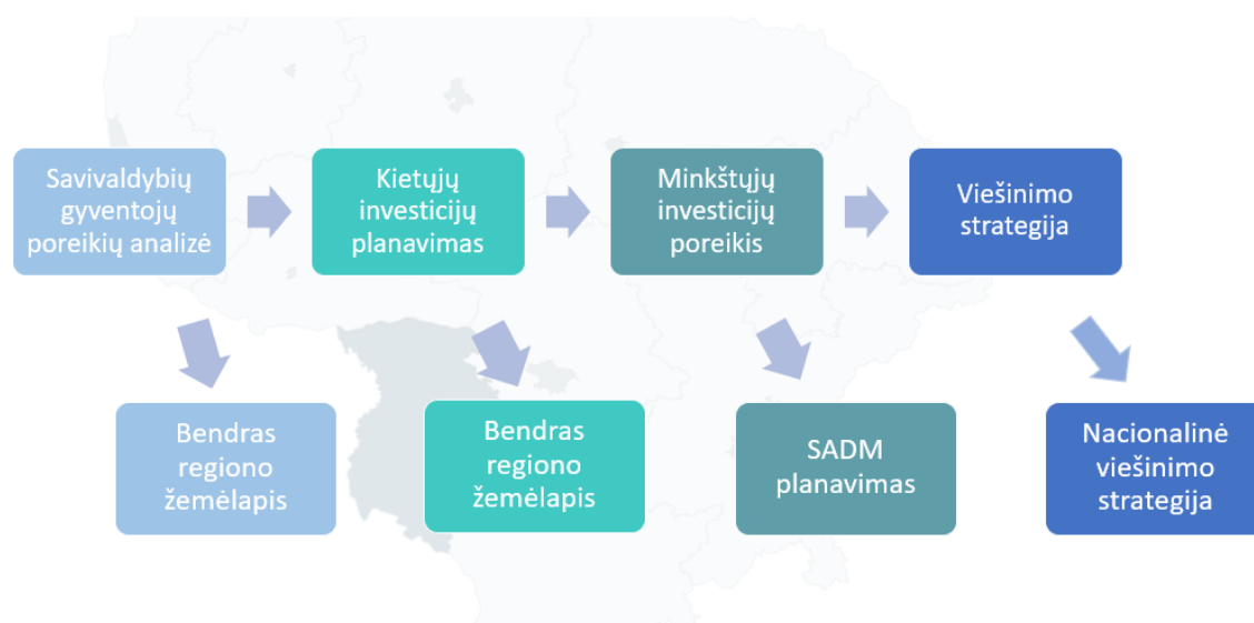
2 pav. Savivaldybių Žemėlapiuose pateiktos analizės naudojimo kryptys.