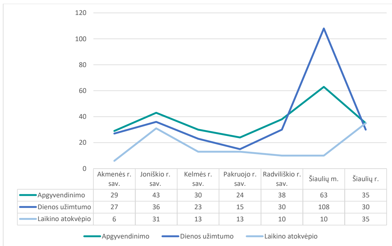
4 Pav. Apgyvendinimo, dienos užimtumo ir laikino atokvėpio paslaugų poreikis bendruomenėje gyvenantiems asmenim (artimiesiems)

Atkreiptinas dėmesys, kad šiuos duomenis reikia vertinti kaip bendrąją statistiką, todėl, kad rezultatai atskleidžia tik paslaugų teikimo, nukreipto į apgyvendinimą, užimtumą ir artimųjų poilsį, kryptis. Individualių poreikių užtikrinimui būtinas kiekvieno individualaus asmens (šėimos) paslaugų poreikio vertinimas ir individualaus pagalbos plano sudarymas.