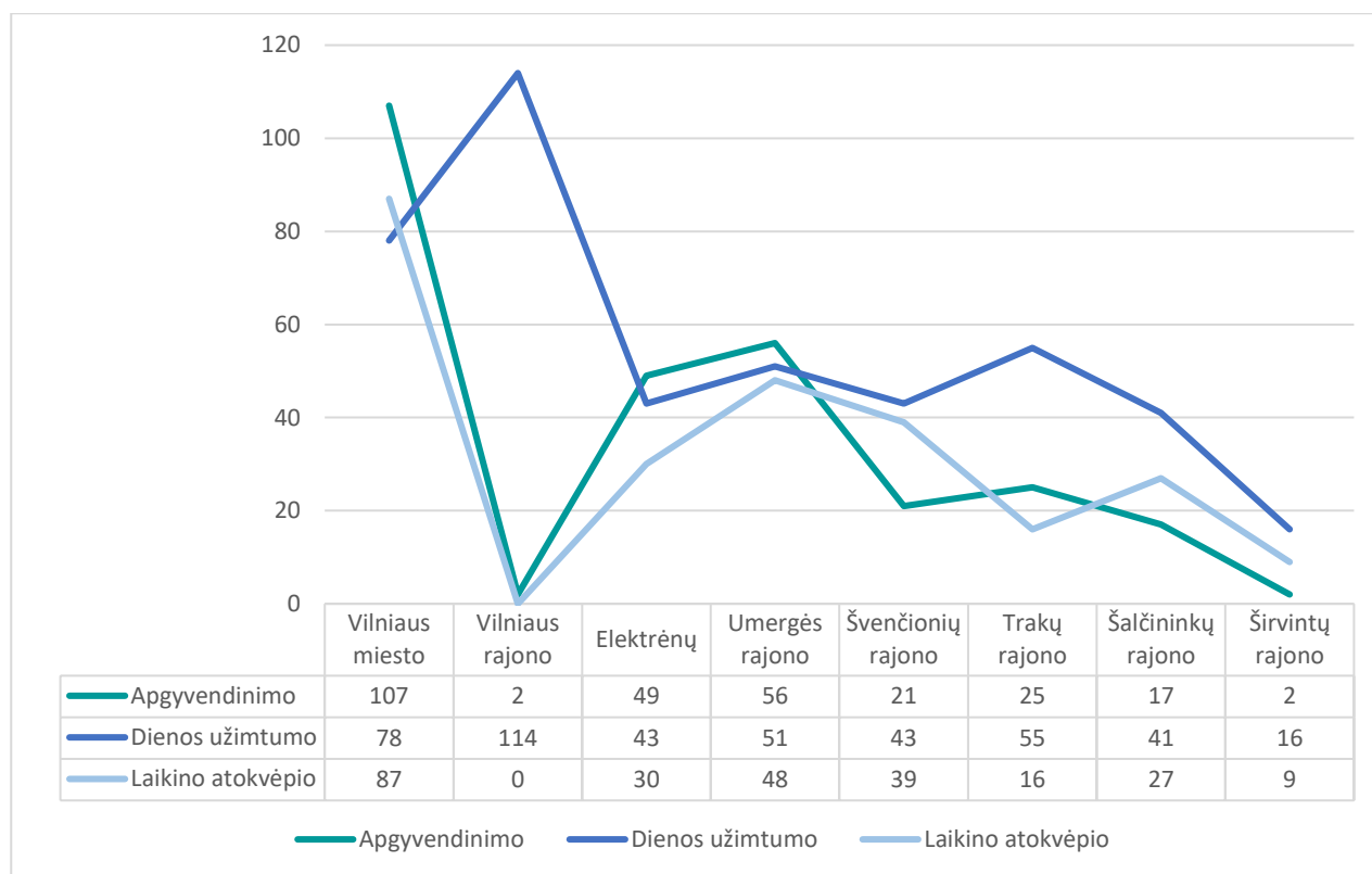
4 Pav. Apgyvendinimo, dienos užimtumo ir laikino atokvėpio paslaugų poreikis bendruomenėje gyvenantiems asmenims (artimiesiems)

Atkreiptinas dėmesys, kad šiuos duomenis reikia vertinti kaip bendrąją statistiką, todėl, kad rezultatai atskleidžia tik paslaugų teikimo, nukreipto į apgyvendinimą, užimtumą ir artimųjų poilsį, kryptis. Individualių poreikių užtikrinimui būtinas kiekvieno individualaus asmens (šeimoms) paslaugų poreikio vertinimas ir individualaus pagalbos plano sudarymas.