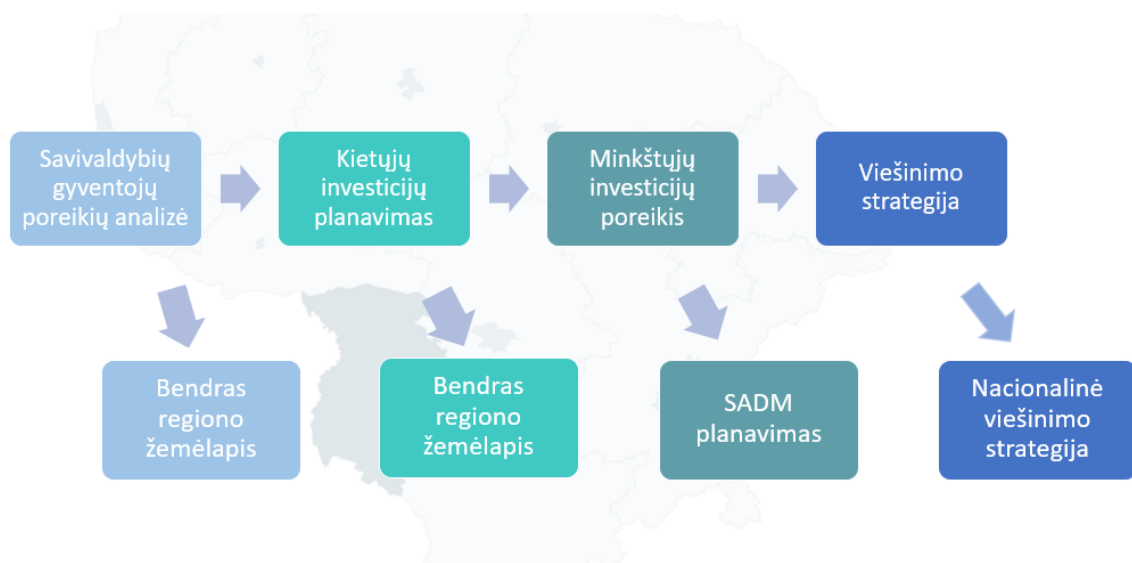
2 pav. Savivaldybių Žemėlapiuose pateiktos analizės naudojimo kryptys.